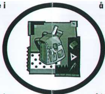
En skolesekk kan inneholde mange ting...

Skolesekken skal i løpet av 10 år fylles med gode kulturopplevelser. Det kan være i form av konserter, utstillinger, workshops med ulike kunstnere, fremføring av egenproduserte forestillinger/ utstilling av eleverarbeider, uteskoleprosjekter, biter av den lokale kulturarven/historien og mye annet. I tillegg til å møte etabler-