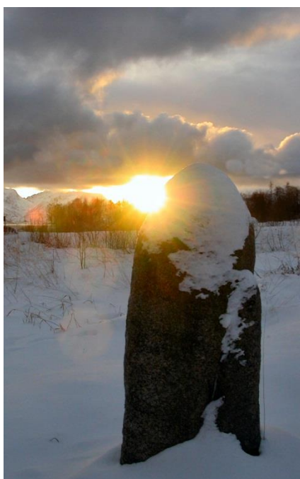
Solsteinen ved Hadsel kulturminnepark