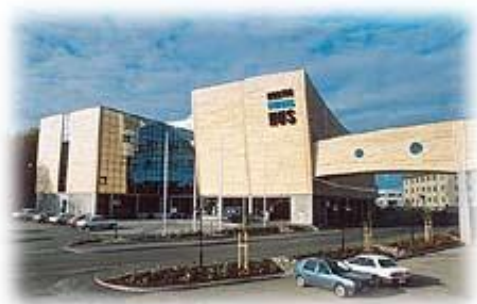
Hurtigrutens Hus, Vesterålen kulturhus

I tillegg har vi Samfunnshuset på Melbu med stor som har ca 300 sitteplasser.