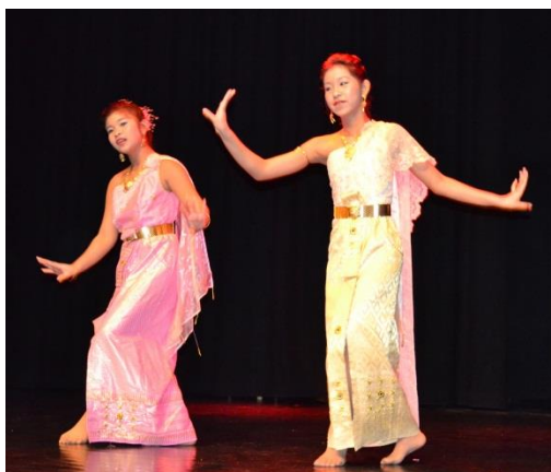
Thailandske jenter danser

Viktige suksesskriterier for å få fylt den kulturelle skolesekken er at rektorene og kulturkontaktene på skolene viderefremmer tilbud som kommer fra sektor kultur. I tillegg må vi ha en del kreativitet blant lærerne, fordi noen av tiltakene er veldig åpne og utfordrer den enkelte skole. Det er viktig at man er bevisst vertskapsrollen man har ved besøk av kunstnere og vertskap for prosjekt.